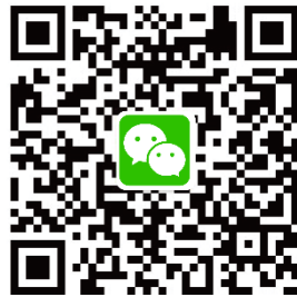
特區政府粵港澳大灣區速遞 (微信公眾號: HKCMAB)