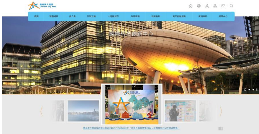
粵港澳大灣區專題網站 ( www.bayarea.gov.hk )