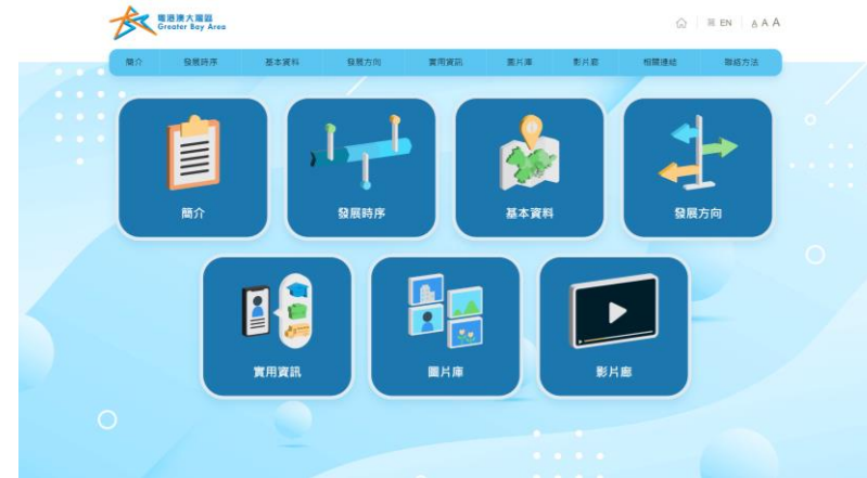
大灣區資訊站 ( www.bayarea.gov.hk/gbais )